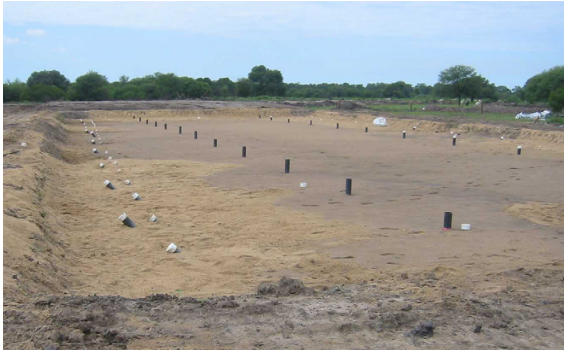
Figura 1.- Instalación de uno de los pantanos

El volumen diario de efluente generado en la planta es de alrededor de 360 m 3 . Durante muchos años la planta de tratamiento consistía en una serie de grandes lagunas llamadas evaporativas, que se fueron colmatando con el tiempo, llegando a un límite de capacidad de depuración. Durante el año 2012 se construyó una nueva planta de tratamiento (Figuras 1 y 2) y se trata actualmente por pantanos secos artificiales ®, New England Waste Systems S.A., tecnología patentada (Puyal, 2010).