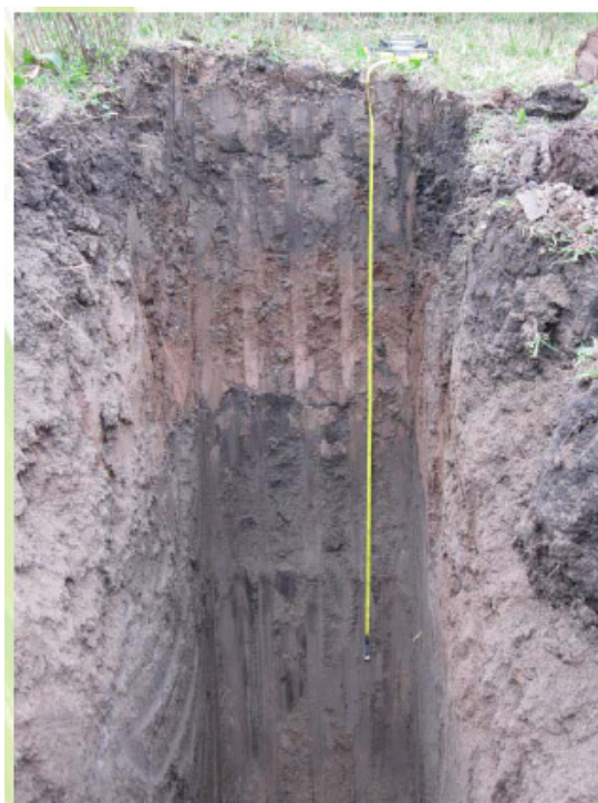
Figura 7.- Pozo de control.