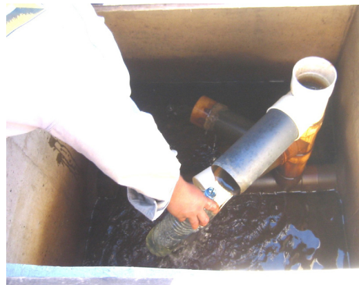
Figura 6.- Muestreo salida lecho de lijado