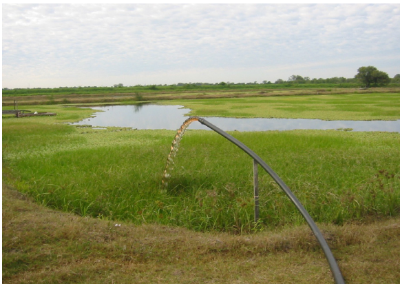
Figura 5.- Uno de los sedimentadores

Para la determinación de la DBO se siguió el método de ensayo 5210 B (Prueba DBO de 5 días), para la determinación de la DQO se siguió el método de ensayo 5220 D (Método Colorimétrico), el análisis de coliformes se realizó según el método 9221 B, todos según American Public Health Association (APHA), American Water Works Association (AWWA), Water Environment Federation (WEF), Standard Methods for the Examination of Water & Wastewater, 21st Edition. (2005). Para la medición del pH, se utilizó un peachímetro HANNA (Romania).