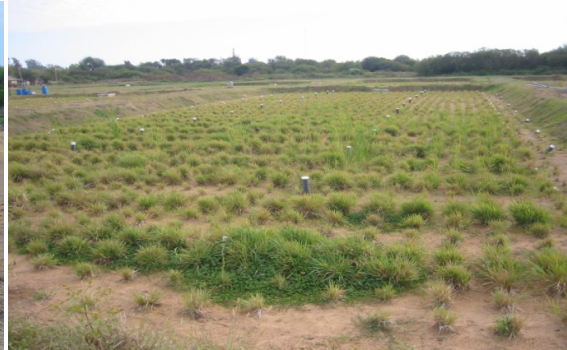
Figura 2.- Crecimiento de las gramíneas

El método es totalmente natural y utiliza la capacidad depuradora de las plantas. El efluente se acumula en dos grandes piletones con fondo de suelo arcilloso. Allí se enriquece adicionando desechos cloacales de la fábrica y del pueblo aledaño y sedimentan los sólidos. Desde estos sedimentadores el efluente se alimenta por gravedad a cuatro lechos denominados de lijado que trabajan en paralelo. Estos lechos, excavados en el terreno arcilloso, están rellenos con arena con un espesor aproximado de 1 metro. El efluente ingresa por una red de caños con agujeros, enterrados a unos 10 cm debajo de la superficie irrigando las plantas sembradas. Los pantanos secos no poseen espejo de agua y de ahí proviene su nombre. De esta manera se previene la