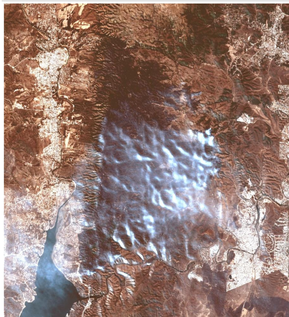
Humo en dirección Oeste Combinación de Bandas (4-3-2)